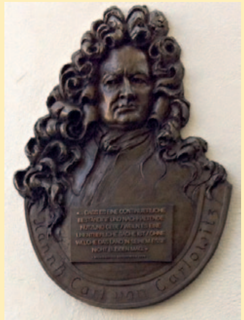
Im Rahmen des Festaktes „300 Jahre Nachhaltigkeit“ der TU Bergakademie Freiberg wurde am 24. April 2013 ein Reliefporträt am Wohnhaus des Oberberghauptmanns H.C. von Carlowitz angebracht.

Das Buch integriert neben seinen weitreichenden Erfahrungen in Bergbau und Forstwirtschaft auch die Erkenntnisse der französischen Kameralistik.